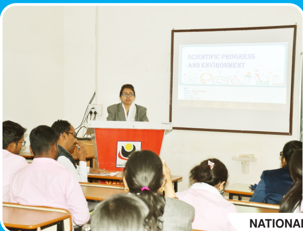
NATIONAL SCIENCE DAY