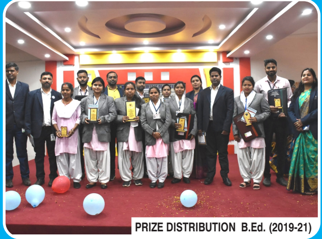
PRIZE DISTRIBUTION B.Ed. (2019-21)