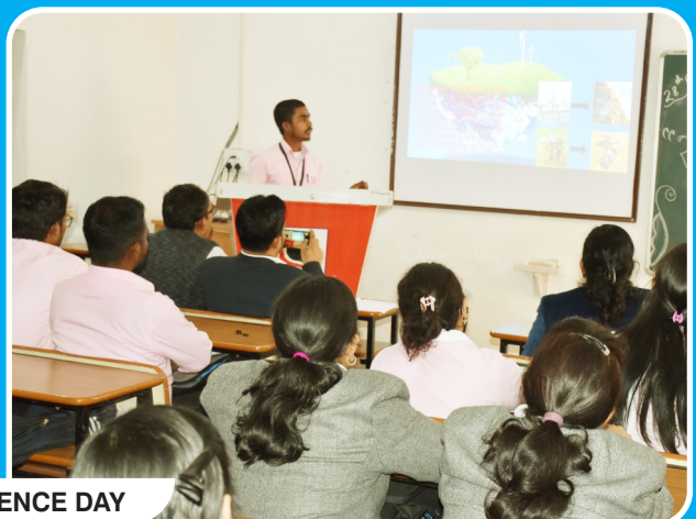
NATIONAL SCIENCE DAY