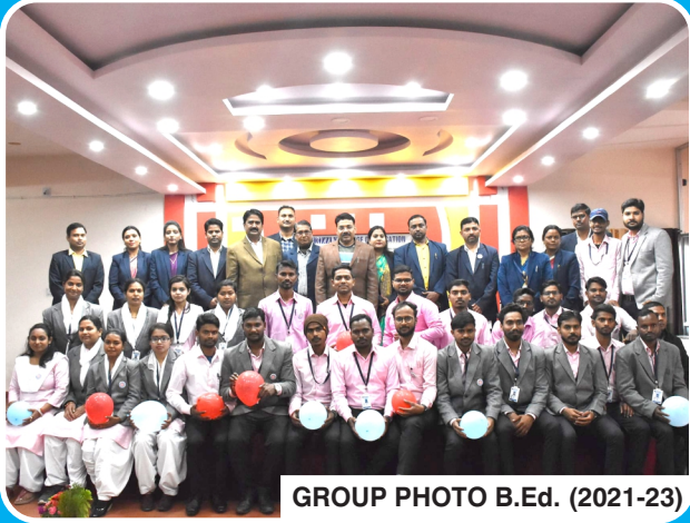
GROUP PHOTO B.Ed. (2021-23)